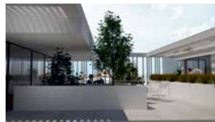
VILA FLOR GALLERY By PLANOMAIS Arquitectura