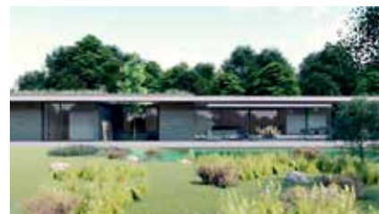
QUINTINHAS ENCOSTA DE JOANE By ARTEQUÍTECTOS Planeamento e Arquitectura