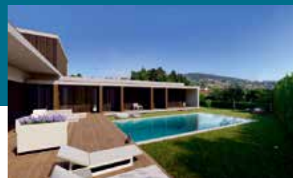
QUINTA DA ESPINHOSA By ARTEQUÍTECTOS Planeamento e Arquitectura