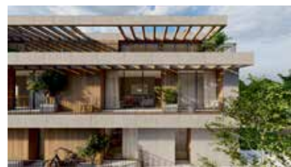
CUTILEIROS PRIME LIVING By PLANOMAIS Arquitectura